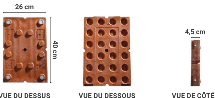
VUE DU DESSUS